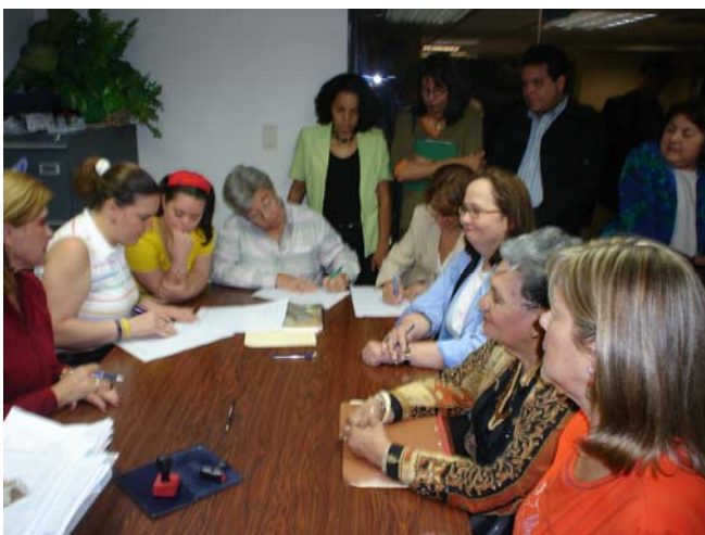
Firma del Documento de FEVEDI en el Registro