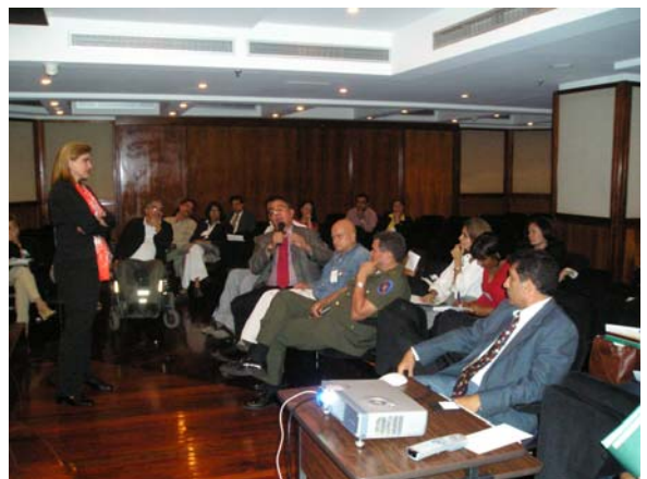
Plenaria de Debate