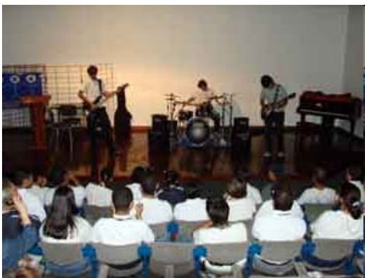
CONCIERTO DE LA BANDA DE LA PROMOCIÓN 40 A LOS NIÑOS DE ASODECO (AVEMUNDO)