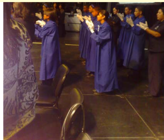
Coro Manos Blancas

En suma creo que para mí esta fue una de las enseñanzas más importantes de este encuentro, que para generar cambios importantes y significativos es indispensable que trabajemos juntas todas aquellas personas que de una forma u otra convivimos diariamente con la discapacidad.